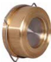
T-0310 | Messing

DN 15 .. 100 | PN 16 Scheibe : AISI 304 SS Feder: AISI 302 SS