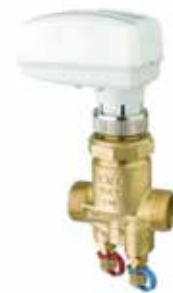
T-4014 | DZR Messing

½" .. 1 ¼" | PN 16 Motorisiert Mit Gewinde