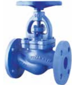
T-0110 | Gusseisen

DN 15 .. 200 | PN 16 DN 250 - 300 | PN 10 Geflanscht Scheibe: AISI 420 SS (DN 15 .. 100) ST37 + Edelstahl (DN 125 .. 300)