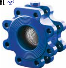
CVT-1010 | Duktiles Gusseisen