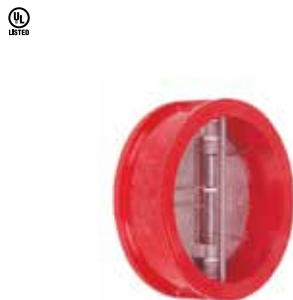
Y-4064 Duktiles Gusseisen

DN 50 .. 200 | PN 16 Scheibe: Edelstahl (AISI 316) Marke: Mech