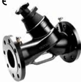
T-3020 | Gusseisen