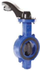
T-1130 | Duktiles Gusseisen

DN 65 .. 200 | PN 25 Scheibe: Duktiles Gusseisen, Gummiert Stirnseitendichtung: EPDM