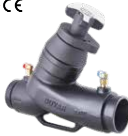
T-3025 | Duktiles Gusseisen

1 ½" .. 12" 235 Psi (16 Bar) Variable Düse