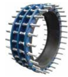
T-5130 (PN 10) T-5140 (PN 16) T-5150 (PN 25)