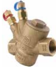
T-4010 | DZR Messing