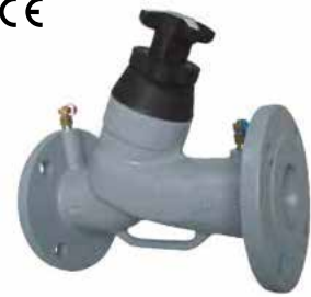
T-3027 | Duktiles Gusseisen

1 ½" .. 12" | Class 125 235 Psi (16 Bar) Variable Düse