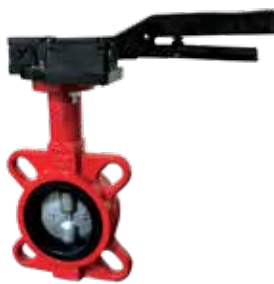
T-0911 Gusseisen DN 65 .. 200 300 Psi (20,6 Bar) Mit Getriebe