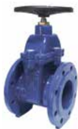
T-1437 | Duktiles Gusseisen

DN 40 .. 300 | PN 16 WRAS-zugelassen Geflanscht