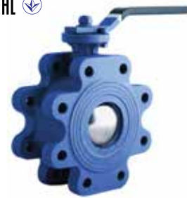
CDY-1030 | Duktiles Gusseisen

DN 65 .. 200 | PN 16 Reduziertem Durchgang