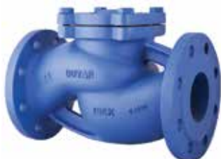
T-0250 | Gusseisen

DN 15 .. 200 | PN 16 DN 250 .. 300 | PN 10 Geflanscht