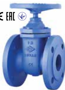
T-1320 | Gusseisen

DN 40 .. 150 | PN 10 DN 200 .. 300 | PN 6 DN 350 .. 500 | PN 4 DN 600 .. | PN 2,5 Geflanscht