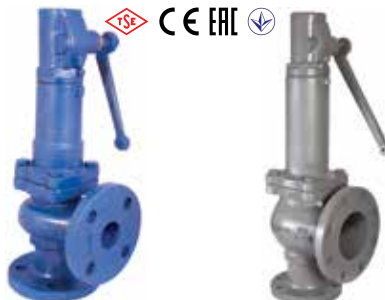
T-1515 T-1530 Duktiles Gusseisen Duktiles Gusseisen

Proportionalhub Vollhub DN 25 .. 100 | PN 16 Geflanscht (Corner Type) Spring&Seat: Edelstahl Scheibe&Stem: Edelstahl