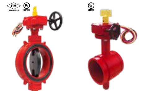
Y-4020 Duktiles Gusseisen DN 65 .. 200 300 Psi (20,6 Bar) Mit Getriebe Y-4025 Duktiles Gusseisen DN 65 .. 200 300 Psi (20,6 Bar) Mit Gerieft