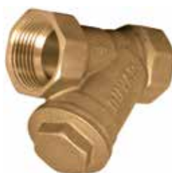
T-2220 | Messing

Mit Gewinde ½" .. 3" | PN 16 O-Ring: EPDM Filter: Edelstahl