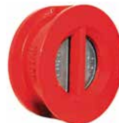
T-0330 | Gusseisen

DN 50 .. 250 | PN 16 Scheibe: Duktiles Gusseisen