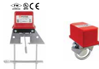
Y-3008 Überwachungsschalter 2" .. 12" Für OS&Y-Schieberventile Marke: Potter Durchflussschalter Y-3004 1" .. 8" 350 Psi (24,1 Bar) Marke: Potter Y-3003 2" .. 8" 450 Psi (31 Bar) Marke: Duyar