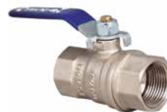
T-2110 | Messing

Mit Gewinde ½" .. 2" | PN 25 2 ½" .. 4" | PN 16 Roller Durchgang