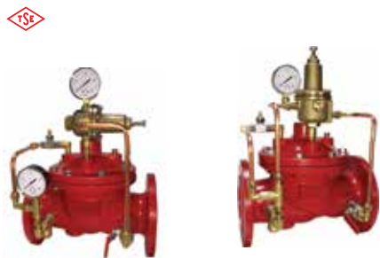
Y-7000 Druckminderventil Duktiles Gusseisen Y-7010 Überdruckventil Duktiles Gusseisen

2" .. 8" 250 Psi (17,2 Bar) Geflanscht PN 16 Kupferleitung