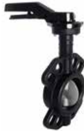
T-1135 | Gusseisen T-1136 | Gusseisen

DN 50 .. 200 | PN 16 Gummiert Disc: Duktiles Gusseisen, Vernickelt Seat: EPDM (or NBR) DN 50 .. 200 | PN 16 Gummiert Scheibe: Edelstahl (CF8) Seat: EPDM