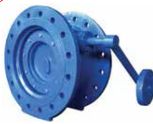
T-5160 (PN 10) T-5170 (PN 16)