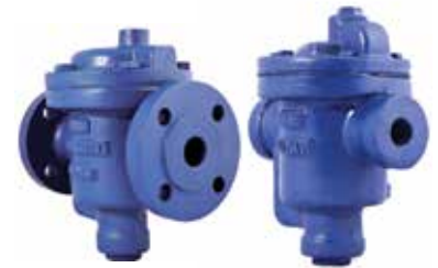
T-1610 | Gusseisen T-1620 | Gusseisen

DN 15 .. 50 | PN 16 Geflanscht Behälter: AISI 304 SS DN 15 .. 50 | PN 16 Mit Gewinde Behälter: AISI 304 SS