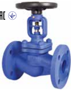
T-0160 | Gussstahl T-0170 | Gussstahl

DN 15 .. 250 | PN 16 Geflanscht Scheibe: AISI 420 SS DN 15 .. 250 | PN 40 Geflanscht Scheibe: AISI 420 SS