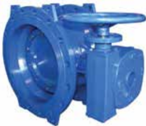
T-5110 (PN 10) T-5120 (PN 16) T-5125 (PN 25)

Duktiles Gusseisen DN 80 .. 2000 | PN 10 / 16 DN 100 .. 300 | PN 25