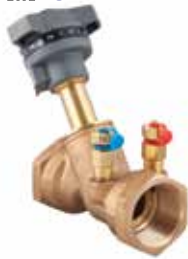
T-3010 | Bronze