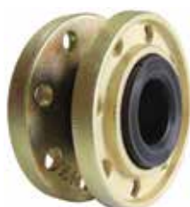
T-1810 | Duktiles Gusseisen

DN 25 .. 600* | PN 16 Flansche: Duktiles Gusseisen + Verzinkt Anschluss: Geripptes Gummi