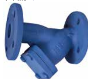
T-0820 | Gusseisen

DN 15 .. 400* | PN 16 Geflanscht Filter: AISI 304 SS