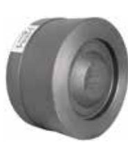
T-0320 | Duktiles Gusseisen

DN 15 .. 100 | PN 16 Scheibe : AISI 304 SS Feder: AISI 302 SS