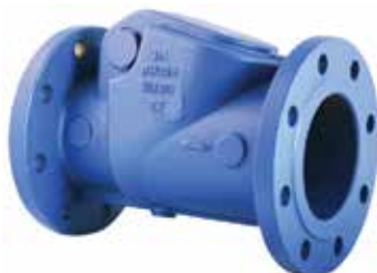
T-0410 | Gusseisen

DN 40 .. 350 | PN 16 Geflanscht Scheibe: Duktiles Gusseisen + Gummiert Stem: AISI 420 SS