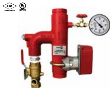
Y-4070 Duktiles Gusseisen

2", 2 1/2", 3", 4", 6" 300 Psi (20,7 Bar) Gerieft