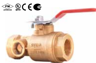
Y-4030 | Messing

1/2" Düse K5.6 (80) 1/32" Düse K8.0 (115)